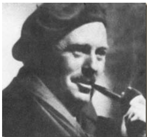
Paul de Kruif

Sinclair Lewis desarrolla ideas y conceptos científicos con una sorprendente soltura. Esto se debió sin duda a que fue asesorado por el microbiólogo y escritor Paul de Kruif (1890-1971), autor del excelente y popular ensayo Cazadores de microbios (1926), una obra clásica que ha inspirado a generaciones de médicos y biólogos. De hecho, su colaboración en Dr. Arrowsmith fue tan decisiva que finalmente se acordó que recibiera el 25% de los derechos de autor de la obra.